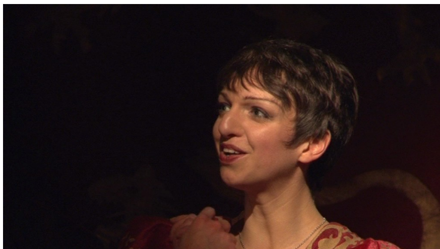
«La Jument du Roi»